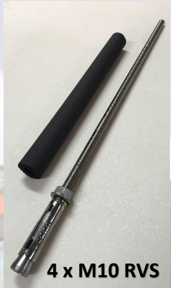
4 x M10 RVS