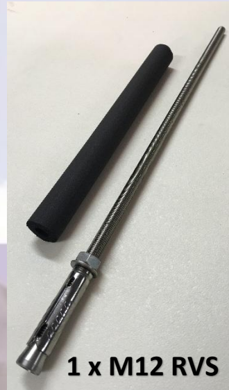
1 x M12 RVS